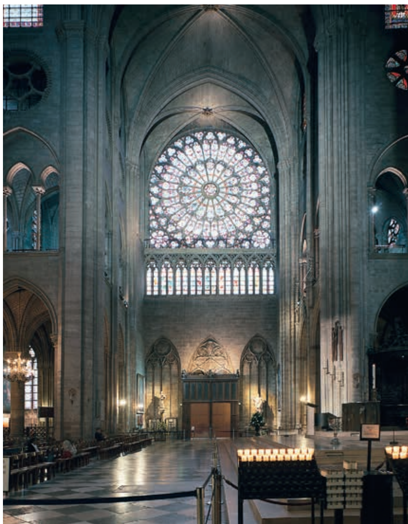
Rosace nord de Notre-Dame de Paris