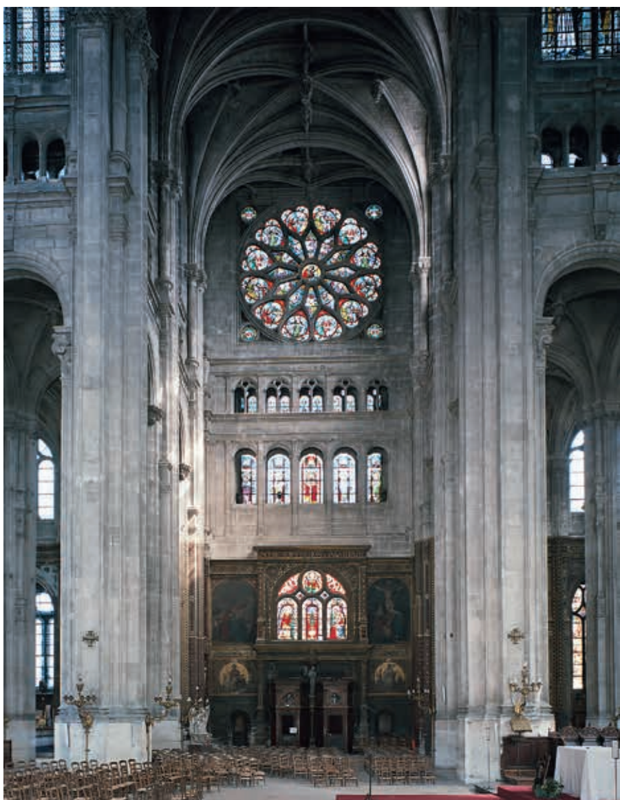
Rosace de Saint-Eustache