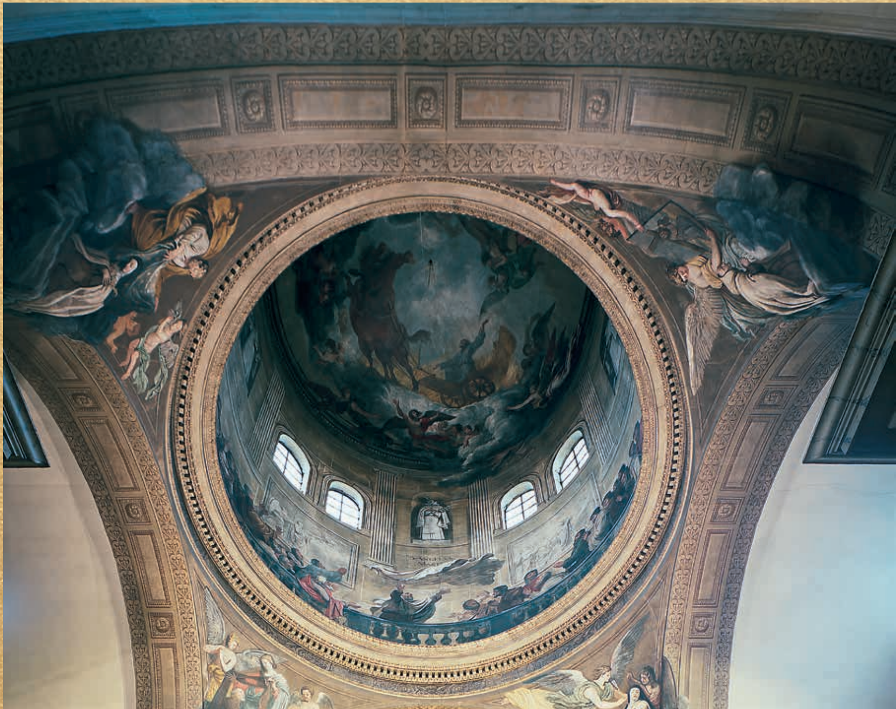
Voûte de Saint-Joseph-des-Carmes